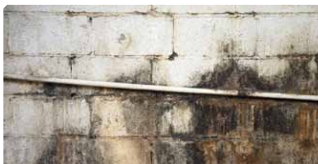
■ Umidita e microrganismi sopra il supporto