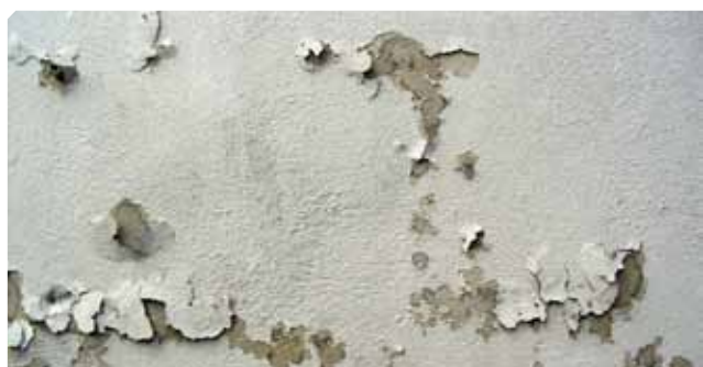
■ Fondo vecchio mal aderito