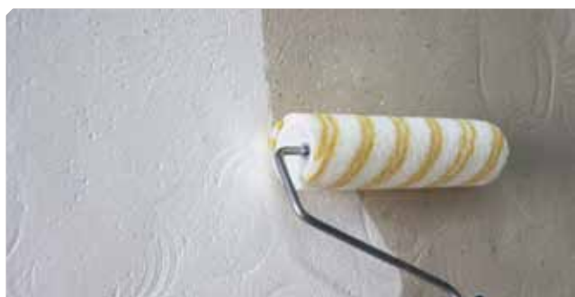
■ Imprimitura del supporto con il consolidante all'alcool