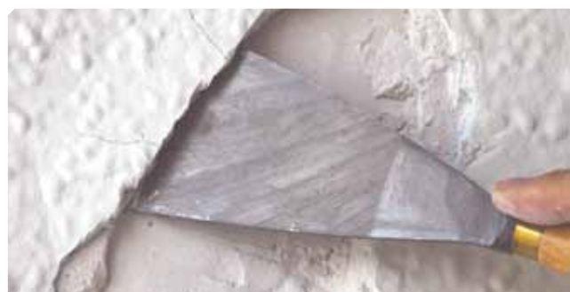
■ Vecchio fondo mal aderito