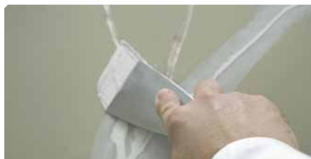
■ Fessure superiori a 2 mm. trattate con stucco elastico