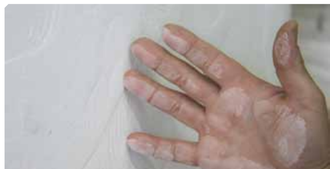
■ Supporto polveroso